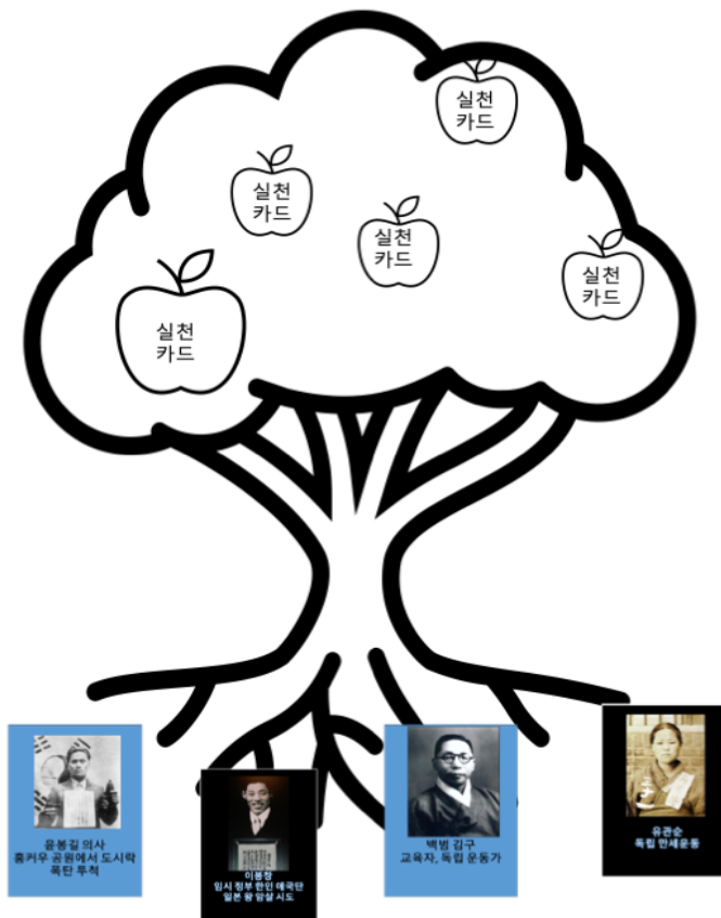
(첨부 6: 책갈피)

우리는 우리의 시체로 성벽을 삼아서 우리의 민족의 독립을 지키고, 우리의 시체로 발판을 삼아 우리 민족의 자존을 높이고, 우리의 시체로 거름을 삼아서 우리 민족의 문화의 꽃을 피우고 열매를 맺어야 한다.